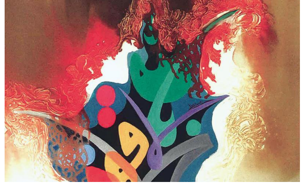
شكل (2) التصوير الاسلامي والحرف المرئي

جوانب منها، الإخراج الفني وتصميم الحروف وتنسيق الصفحات وتصميمها وإخراجها، فيكشف لنا التصميم هوية الشخص وشخصيته من خلال رسوماته وتصاميمه. وهذا ما تجسد في التصوير العربي الاسلامي وعبر اعمال فناني الكرافيك ومنجزهم الذي يتجه نحو أداء الحداثة التجريدية بعد استمرارية ومسافة من الاشتغال التقني.