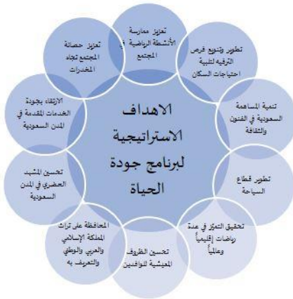
شكل (4) الأهداف الاستراتيجية لبرنامج جودة الحياة (تصميم الباحثة)

قطاعات جودة الحياة المختلفة، وأطلق العديد من الأكاديميات والمعاهد والبرامج التي تُعنى بتطوير المواهب. كما عني البرنامج بتطوير القطاع السياحي في المملكة، والإسهام بتعزيز مكانة المملكة كوجهة سياحية عالمية. منها إطلاق التأشيرة السياحية، وزيادة المواقع التراثية المدرجة في قائمة اليونسكو للتراث العالمي وتوطين المهن القيادية. ويواصل برنامج جودة الحياة خلال المرحلة الحالية والمقبلة لتمكين قطاعات الثقافة والتراث، والرياضة، والترفيه، والسياحة، إضافة إلى قطاع الهوايات.