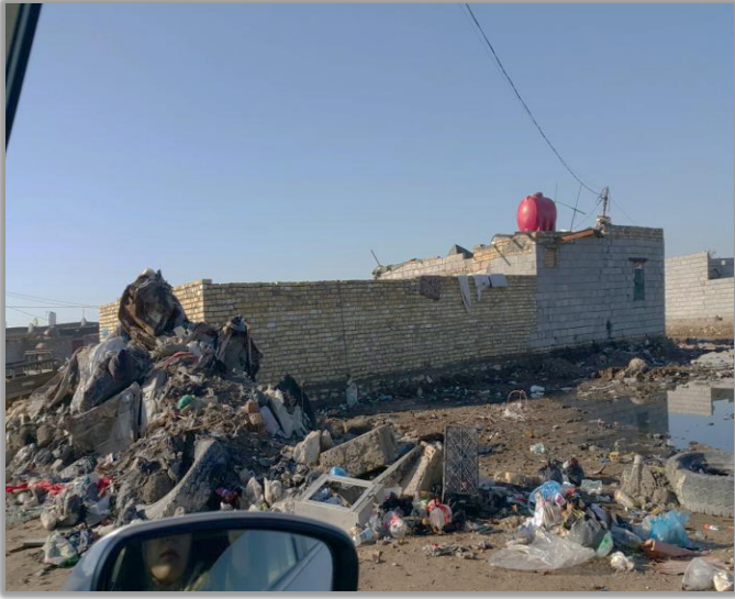
صورة (2) التلوث البصري في المناطق العشوائية