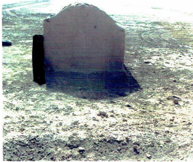
صورة (6): تلؤل أثرية تبدو من بعيد موجودة في اراضي زراعية عشائرية أخذت الصورة بتاريخ 2010-11-13