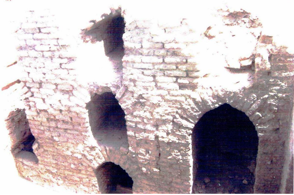
صورة (3): المقبرة الرئيسية في تل الأجز الذي لم يستكمل فيه التنقيب والترميم أخذت الصورة بتاريخ 2009-7-26