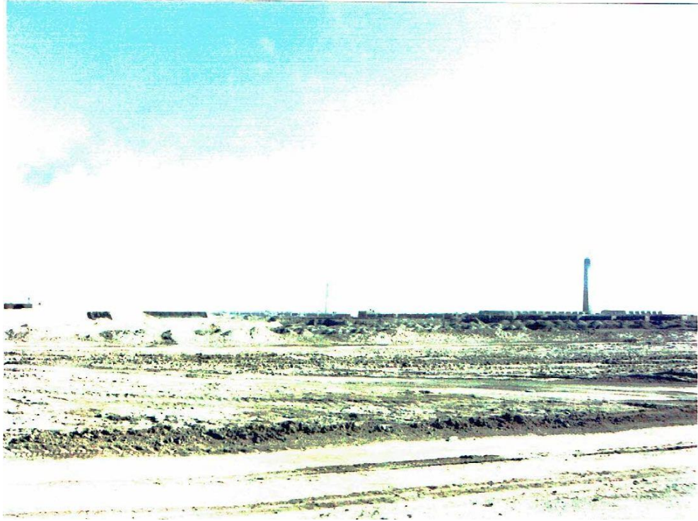
صورة (5): معامل الطابوق قرب موقع الطلي ويبدو واضحاً الدخان الملوث للبيئة - أخذت الصورة بتاريخ 2010-11-13