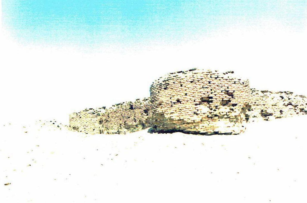
صورة (4): قلعة الكصير في قضاء الخضر وتبدو عليها آثار الاهمال أخذت الصورة بتاريخ 2011-3-26