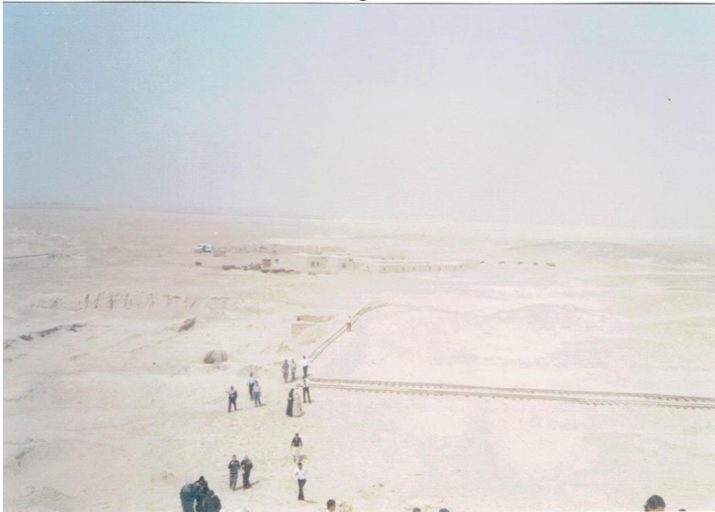
صورة (2): مدينة الوركاء الأثرية التي لم تستكمل فيها التنقيبات. وقد صورت من أعلى الزقورة - أخذت الصورة بتاريخ 2010-1-10