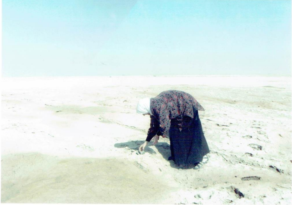
صورة (1): الباحثة عند زيارة احد التلول الأثرية أخذت الصورة بتاريخ 2010-11-13