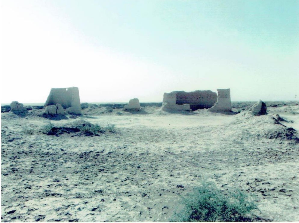
صورة (7): موقع اثري قرب اطلال قرية لخدمات ولا طرق معبدة له أخذت الصورة بتاريخ 2010-11-13